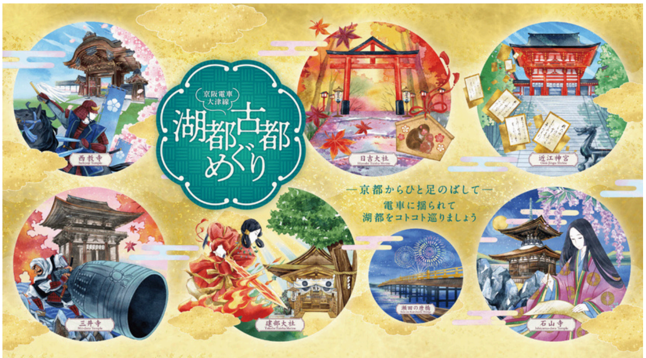
京阪電車・大津線「湖都古都めぐり」ラッピング電車用イラストレーション